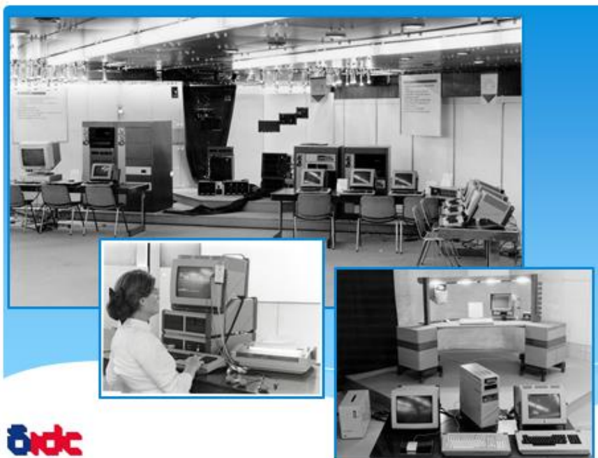
Slika 4: Predstavitev na Letni šoli Iskre Delte '85: Delta 800, ekvivalent DEC PDP-11, sledi Delta EKG rešitev in zadnja slika Triglav Pico z natičnimi diski.