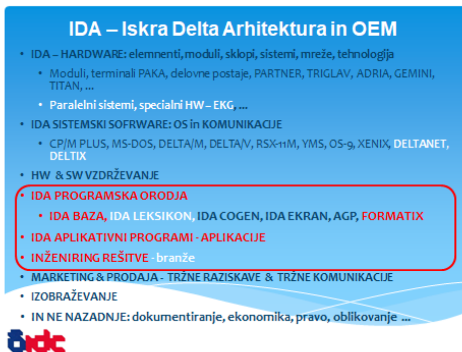
Slika 6: IDA – Iskra Delta Arhitektura, poudarek je na Ida programskih orodjih in informacijskem inženiringu po branžah

je začelo v Delti obdobje širitve dejavnosti od računalništva v ožjem pomenu besede na informacijski inženiring organiziran po branžah. V ospredje stopi razmišljanje o IDA – Iskra Delta Arhitekturi. IDA arhitektura pomeni oblikovanje lastne strategije kako odgovoriti in pristopiti k reševanju praktičnih problemov kot sostalna vsklajevanja različnih družin in različnih modelov računalnikov, kako povezati različna sistemsko okolja, kako dvigniti produktivnosti programerjev, kako zagotoviti ponovljivost in prenosljivost aplikativnih programov med različnimi sistemi in sočasno zadržati poenoteno funkcionalnost, kako zgraditi »lego koncept« gradnje kompleksnih branžnih rešitev na osnovi standardnih modulov, kako prilagoditi aplikacije jezikom in okolju jugoslovanskih narodov ter na primer ameriškemu okolju za prve poizkuse izvoza programske opreme (na primer FORMATIX v ZDA), itd.