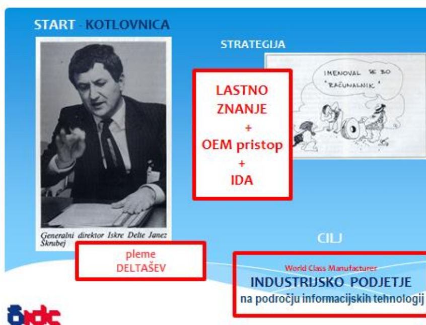
Slika 2: Deltin pristop k postavljanju računalniške firme

Ključ do uspehanamreč ni v kapitalu, strojih, prostorih, ... temveč v sodelavcih. Vsak izmed sodelavcev se mora počutiti kot del plemena, mora ponotranjiti kulturo podjetja in se z njo identificirati. 1,2,4 Delti je uspelo oblikovati pleme Deltašev. To pripadnost je čutiti še danes, sicer se ne bi na štirideseti obletnici ustanovitve Delte na Livadi v Ljubljani letos maja zbralo preko 150 nekdanjih sodelavcev, predvsem iz Slovenije.