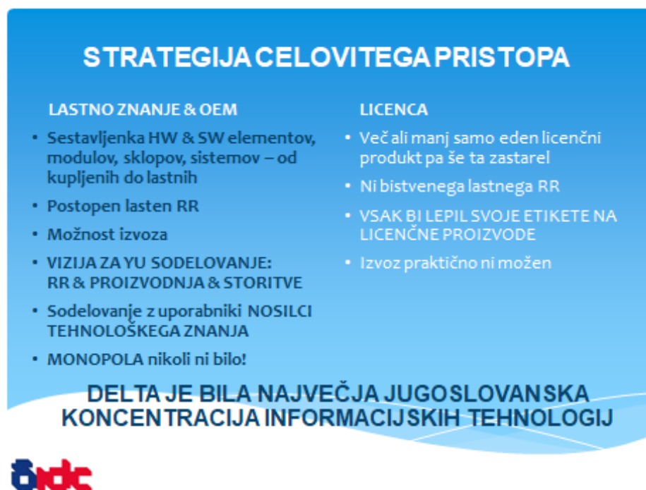
Slika 3: Strategija. Lastno znanje, OEM način proizvodnje in IDA arhitektura

Strategija pove kako nameravamo v naslednjih 5 do 10 letih doseči zastavljeni cilj: narediti lasten računalnik. Strategija ni nekaj dokončnega temveč se sproti dograjuje z novimi spoznanji. Realizacija v praksi pogosto odstopa od zastavljene poti in upošteva trenutne možnosti. Strategija Delte je vsebovala tri pomembne komponente: Uporabo lastne pameti in tehnoloških zmogljivosti povsod, kjer je le mogoče in ekonomsko upravičeno, OEM (Original Equipment Manufacturer) način proizvodnje in ne nazadnje Iskra Delta Arhitekturo (IDA).