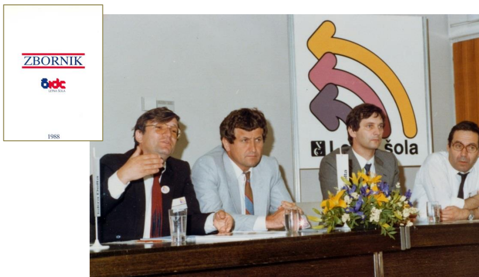
Slika 8: Letna šola Iskre Delte '85 v Cankarjevem domu

Delta je delno uporabila OEM princip tudi pri inženiringu, ko se je pri razvoju branžnih inženiring rešitev povezovala s tehnološko naprednimi uporabniškimi centri in tako obogatila tehnološko znanjespecifično za določeno branžo.